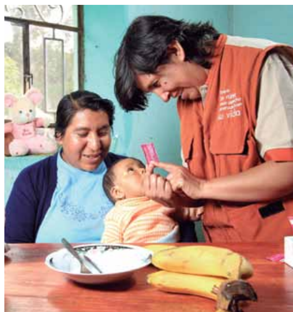
Facilitadora de Alianza por la Nutrición en consejería familiar