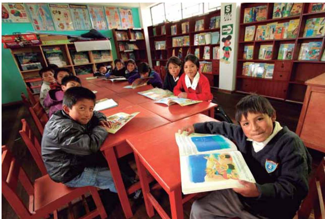
Biblioteca Escolar de IE "San Pedro de Combayo"