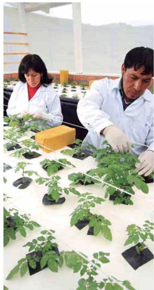
Invernadero Aeropónico de semilla de papa.