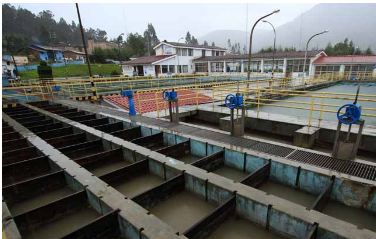
Planta de Tratamiento de Agua Potable "El Milagro" - Sedacaj.