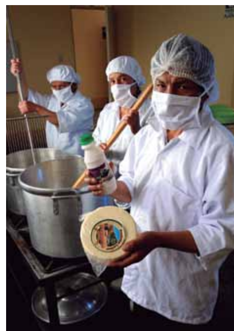
Asociación de Ronderos "Los Perolitos" – Proyecto SUMA.