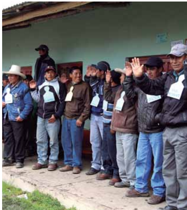
Junta Directiva de CODECO "El Porvenir"