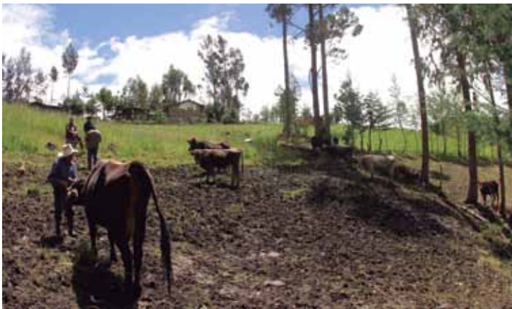
Proyecto de Desarrollo Ganadero.