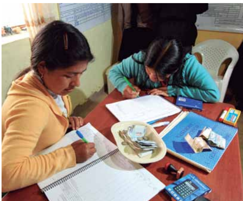
Miembros de UNICA de Porcón.