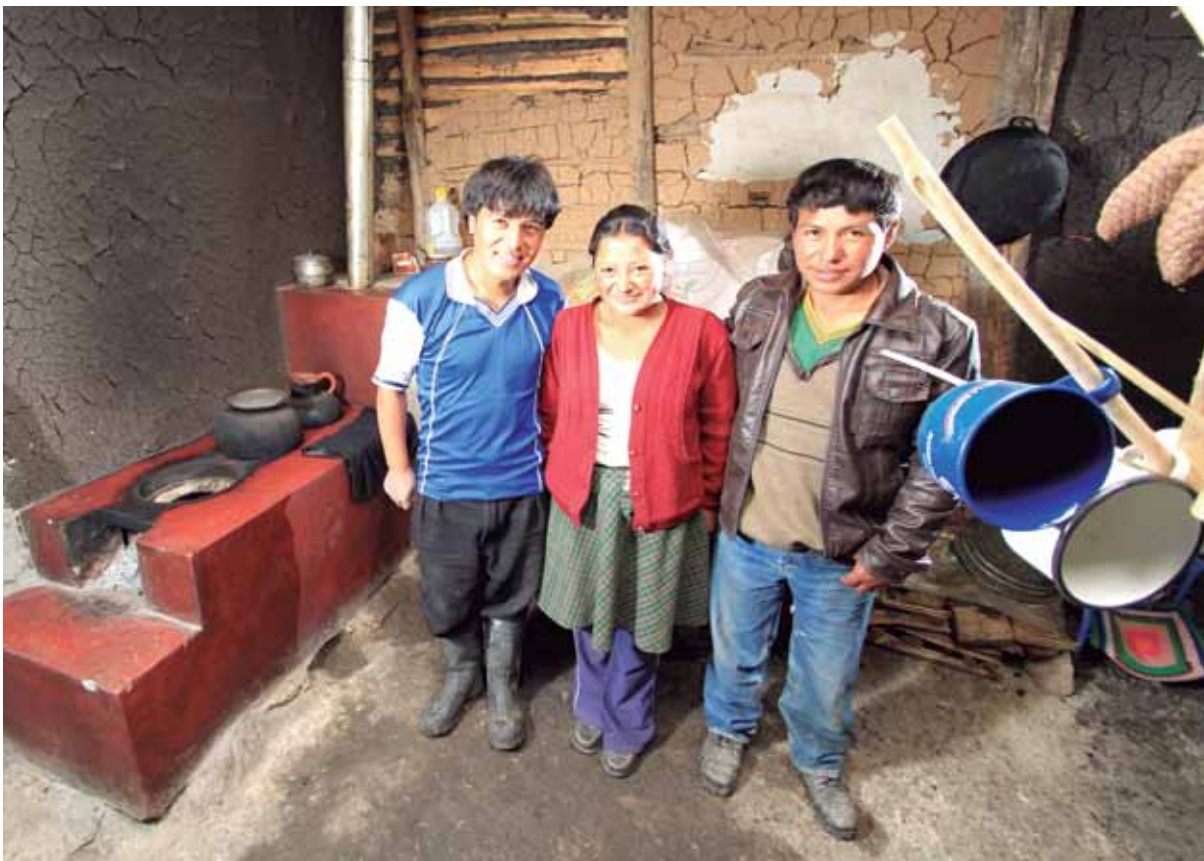
Familia de San Juan de Yerba Buena con cocina mejorada.