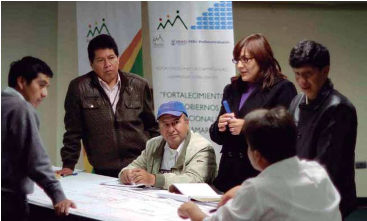
Taller con funcionarios de gobiernos subnacionales.