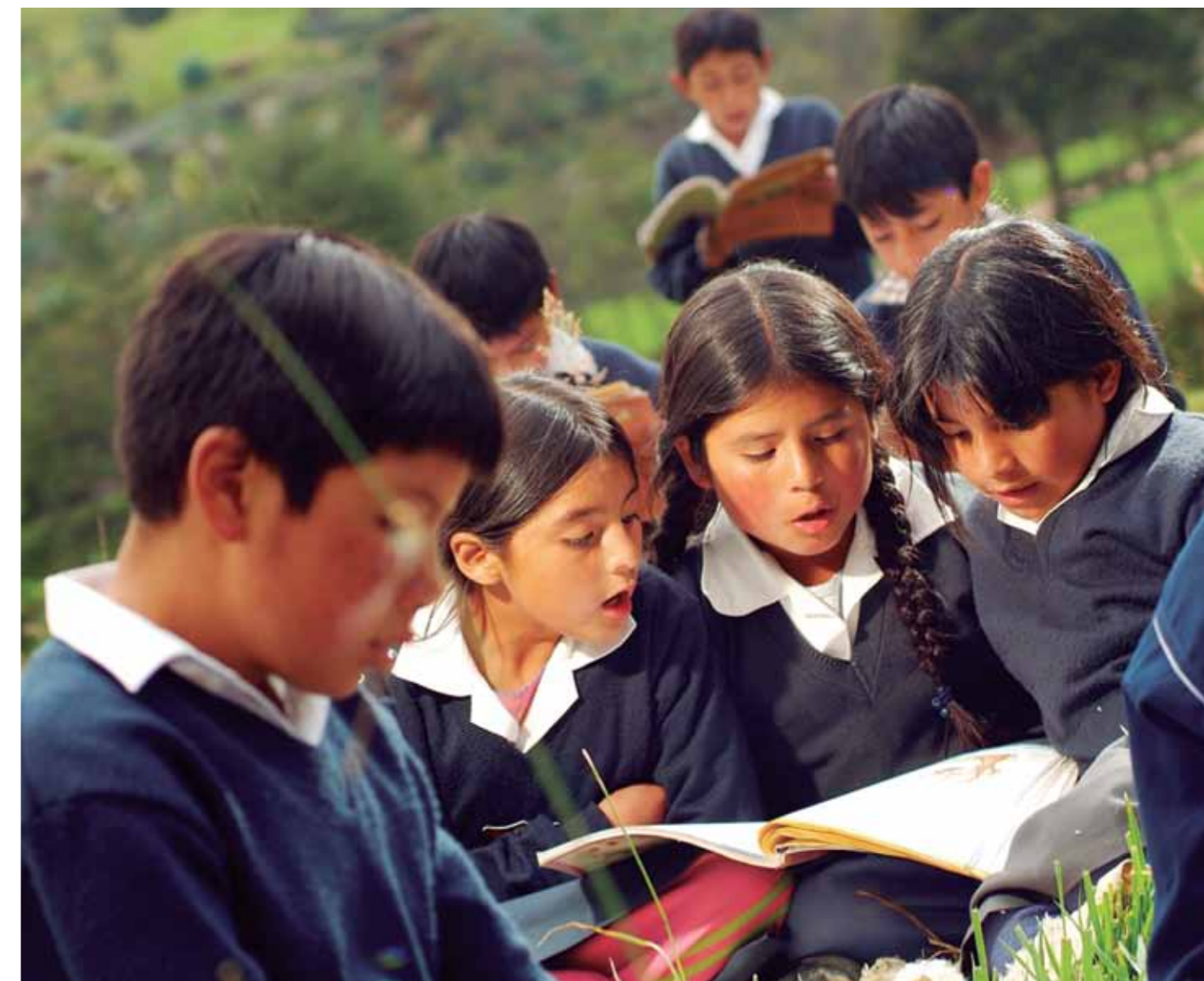
Alumnos de la Institución Educativa de Granja Porcón – Red socioeducativa Cajamarca I – PRIE.

• Plan me Comunico o de comunicación integral en los distritos de Cajamarca y Celendín.