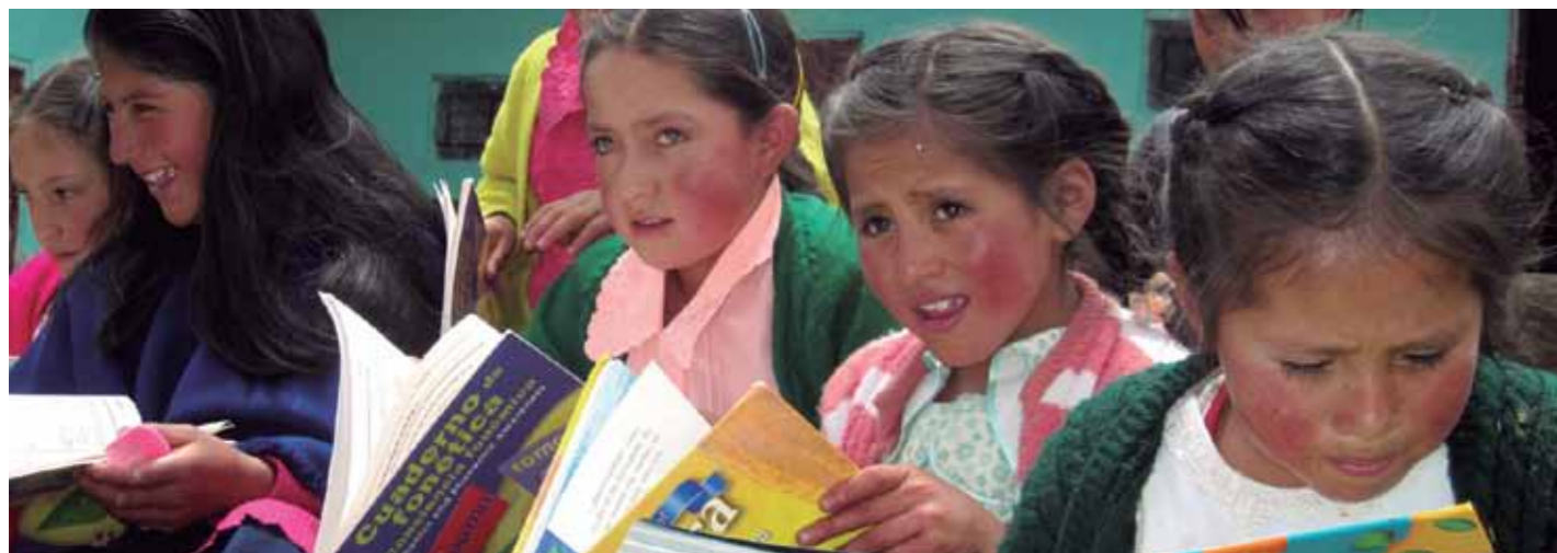
Alumnas de Institución Educativa 10639 – San Lorenzo Bajo de la red socioeducativa La Zanja.