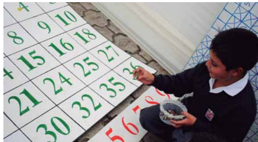
Alumno participando de una estrategia metodológica del Programa Matemática para Todos.