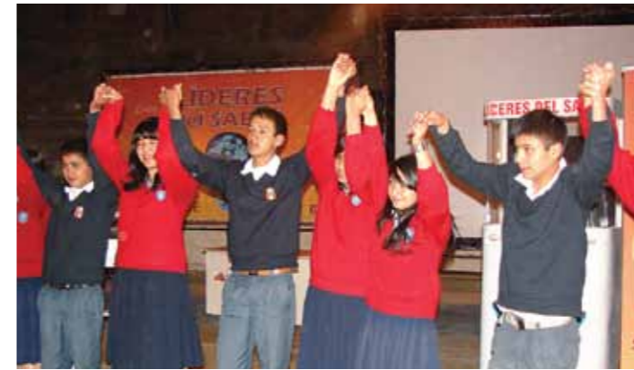
Alumnos de diferentes Instituciones Educativas participando en el concurso Líderes del Saber - Cajamarca.