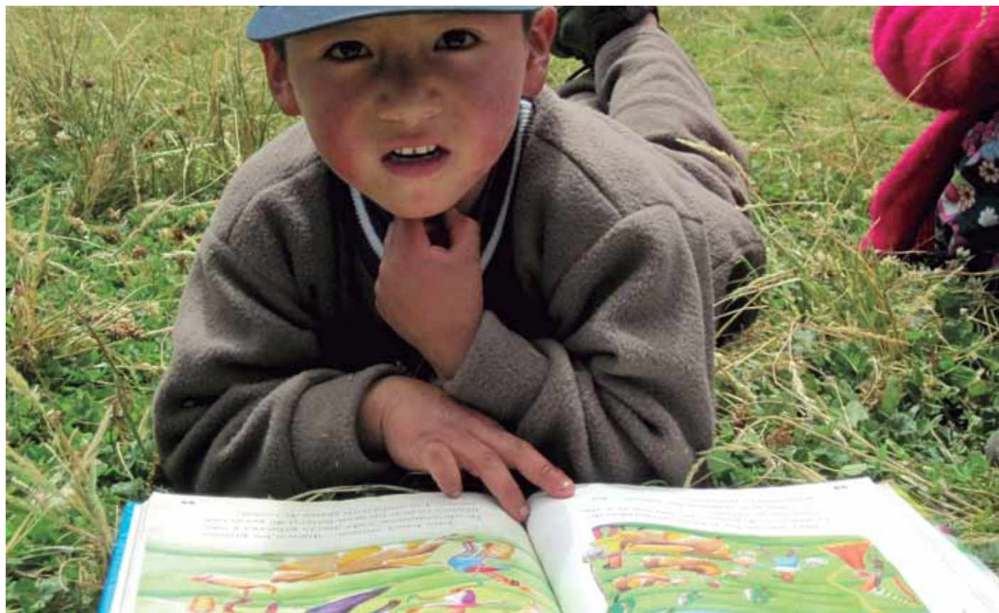
Alumno de la Institución Educativa 10639 de San Lorenzo Bajo – Red socioeducativa La Zanja, participando de la entrega de libros donados por Children International y Rotary Club de Monterrico.