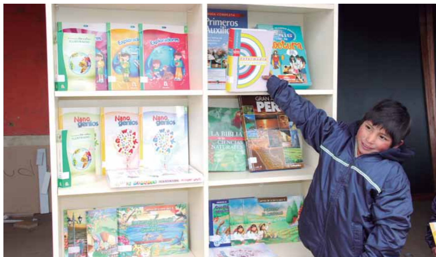
Alumno de la IEGECOM de Agua Blanca – Sorochuco con su biblioteca escolar.

Los kits educativos consisten en: mochila, útiles escolares, libros, enciclopedias, biblioteca, para IIEE del nivel primario y secundario y, juegos didácticos para implementación de ludotecas, en el nivel inicial.