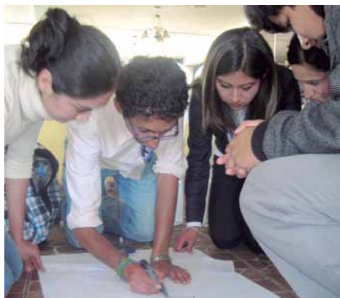
Jóvenes universitarios en taller preparativo para participar del CADE – 2012.

Todas las becas de maestría otorgadas están relacionadas directamente con los ejes principales del Plan de Desarrollo Concertado al 2021 para la Región Cajamarca, que incluyen temas como desarrollo agrícola y pecuario, agroindustria, turismo, desarrollo social y gestión pública, infraestructura para el desarrollo u otros similares, que se constituyen en prioritarios para sacar de la pobreza a nuestra región y garantizar su desarrollo sostenible.