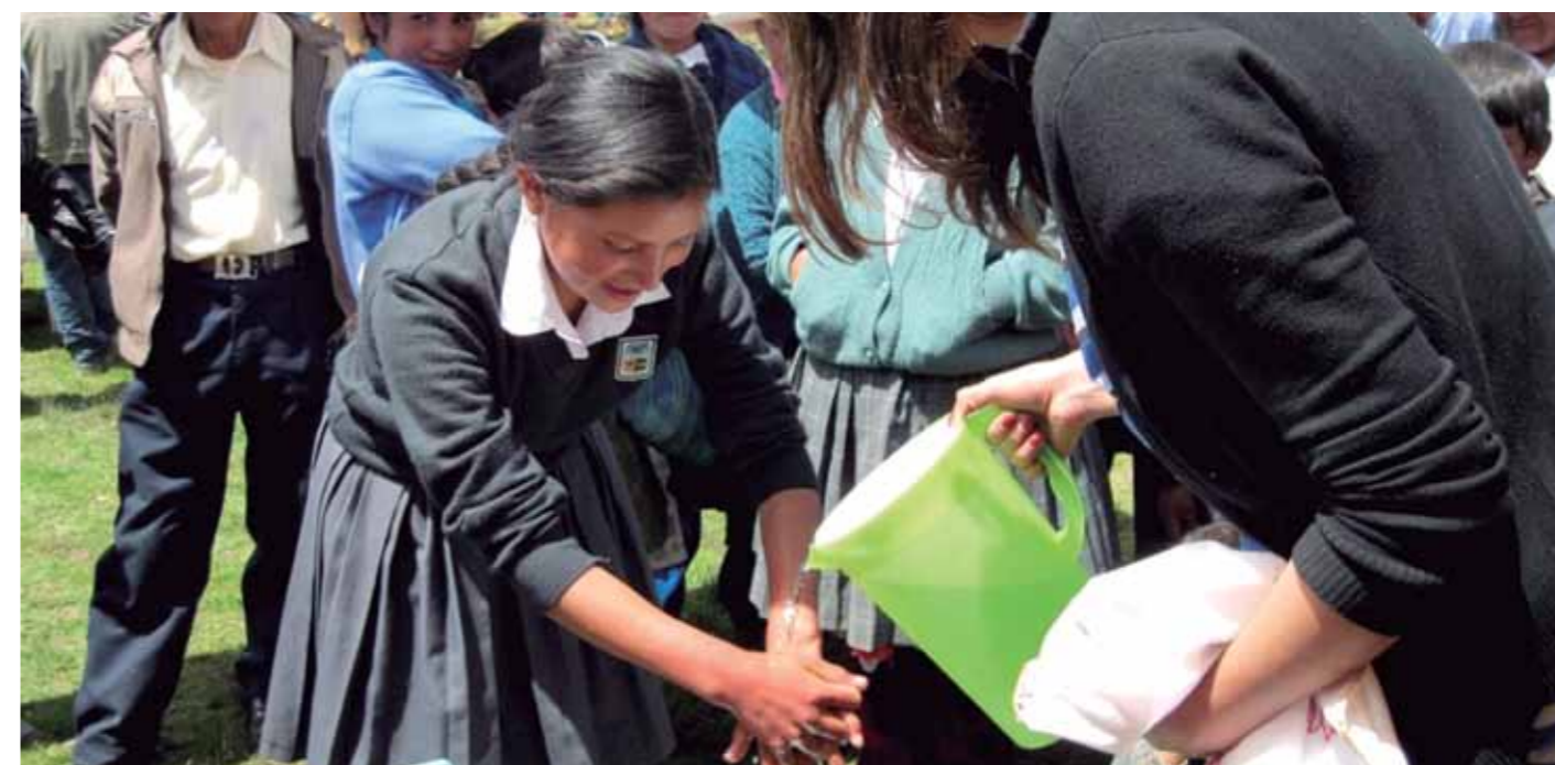
Escolares de Baños del Inca y Cajamarca, participando en campaña de Lavado de Manos.

90% de IIEE del nivel inicial y primario logran la certificación de Escuelas Promotoras de la Salud.