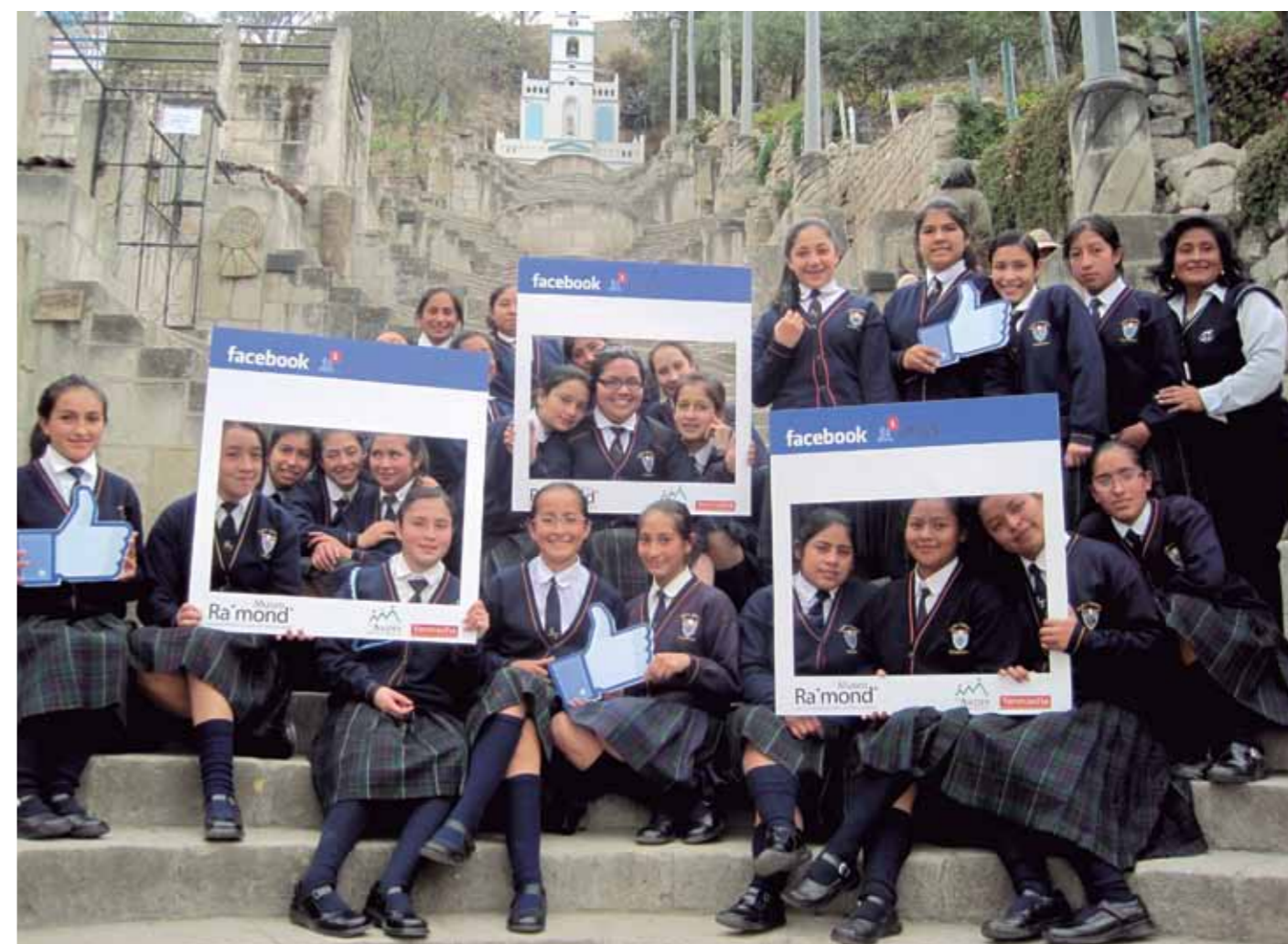
Alumnas de 4to. de secundaria de la Institución Educativa Santa Teresita, participantes de la campaña “La Frase Raimondi”.

Con el fin de estimular, en los alumnos y alumnas de educación secundaria, el conocimiento y valoración del aporte del investigador, naturalista, geógrafo, explorador, escritor y catedrático italiano, Antonio Raimondi, se ha lanzado la campaña a nivel nacional: “Escoge la frase de Raimondi que más te guste”, organizada por el Museo Raimondi de la ciudad de Lima. Dicha iniciativa ha sido coordinada con el área de Educación de la Asociación los Andes de Cajamarca, que está promoviendo la participación de Instituciones Educativas, como Santa Teresita, San Ramón y Dos de Mayo. Los alumnos participantes vienen creando interesantes composiciones literarias en torno a la frase de este célebre italiano, así como la difusión de la diversidad cultural cajamarquina, las mismas que están siendo colgadas en el Facebook del Museo: www.facebook.com/pages/Museo-Raimondi .