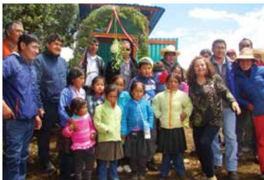
Inauguración del Sistema de Agua Potable y Letrinización, en Quinuapampa.

121 usuarios beneficiados en saneamiento.