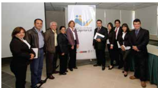
Representantes de la DREC, OEI, UGEL y ALAC | Yanacocha en el desayuno empresarial organizado en el marco del proyecto de Educación Emprendedora.

OEI: Organización de Estados Iberoamericanos para la Educación, Cultura y Deporte.