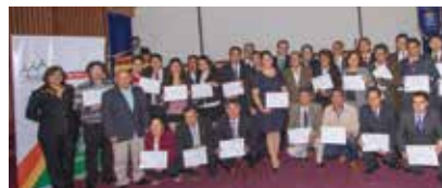
Ceremonia de graduación del “II Diplomado de Gestión Integral de Agua en la Región Alto Andina”.

52 profesionales cajamarquinos participantes.