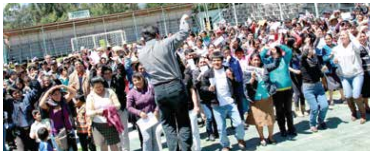
Encuentro de Uniones de Crédito y Ahorro (UNICA), en el marco de cierre del proyecto.