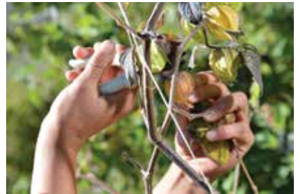
Cosecha de aguaymanto en Celendín.