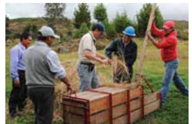
Actividad de henificado en el marco del proyecto ganadero.

Proyecto implementado en los distritos de Cajamarca y Los Baños del Inca.