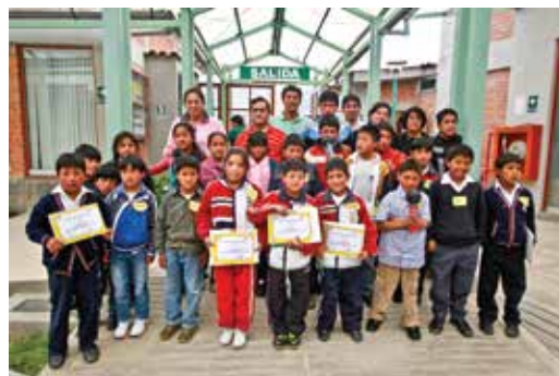
Reporteros de la Educación capacitados y listos para la acción

Desarrollo de Talleres en estrategias para leer en mi tierra utilizando "Mi Biblioteca Escolar".