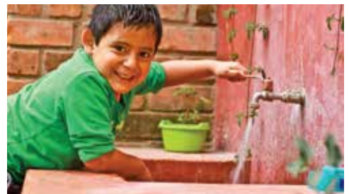
Mayor disponibilidad de agua en hogares cajamarquinos.

beneficiadas con la construcción del SAP de la localidad de Piquillisho.