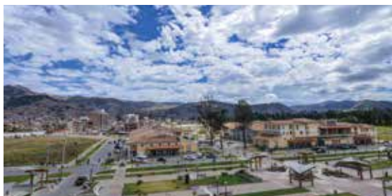
Complejo Qhapac Ñan, cuenta con energía eléctrica.

Se culminó la obra “ Construcción del Alimentador en Media Tensión CAJ010 ”, que permite suministrar energía eléctrica al Complejo Gran Qhapac Ñan.