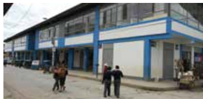
Frontis del centro de abastos de la Provincia Celendín.

661 comerciantes de Celendín capacitados en atención al cliente, manipulación de alimentos y desarrollo personal.