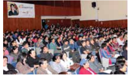
Lanzamiento del Programa Éxito.

Proyecto implementado en los distritos de Cajamarca y Los Baños del Inca.