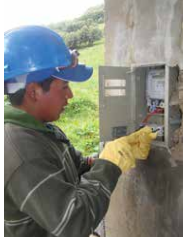
Instalador eléctrico capacitado por el Proyecto Casa Segura Rural.

Proyecto implementado en los distritos de La Encañada y Huasmin.