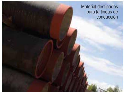
Material destinados para las líneas de conducción

Ampliación de red de agua potable 2007-2009 en la ciudad de Cajamarca V etapa" (Redes Secundarias).