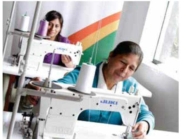
Mujeres emprendedoras de la "Asociación Civil Industrial Textil El Progreso"