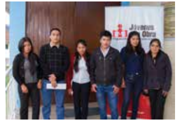
Sustentación de planes de negocio proyecto Jóvenes Emprendedores.

Proyecto implementado en los distritos de Cajamarca, La Encañada y Los Baños del Inca y Celendín