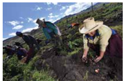
Cosecha de papa en el caserío de Yerba Buena Chica.