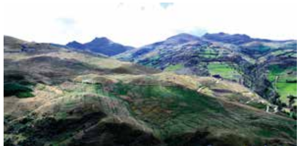
Sistema de riego presurizado en Yerba Buena Chica - La Encañada

5,000 jornales generados equivalentes a 19 empleos temporales.