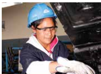
Alumna del módulo de mecánica automotriz.