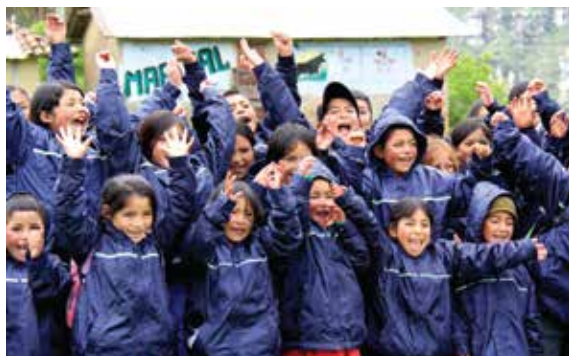
Alumnos de la escuela de Cruz Pampa inician con alegría su primer día de clases

146 Instituciones educativas recibieron bibliotecas escolares.