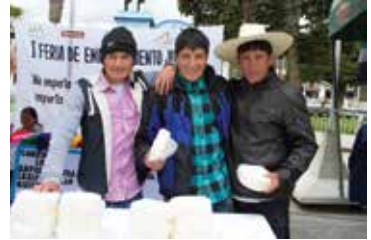
Primera Feria de Emprendimiento Juvenil en Celendín

Proyecto implementado los en distritos Celendín, Huasmin y Sorochuco.