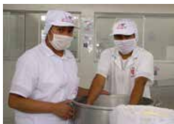
Alumnos en el módulo de derivados lácteos.

Ejecutado por el Programa Vamos Perú | MTPE