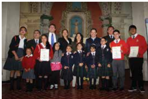
Premiación a los ganadores del concurso de "Colage e Historietas" con las Asociación Educativa Antonio Raimondi.

33,061 visitantes a la Exposición "Tesoros de Cajamarca: La Huella de Antonio Raimondi."