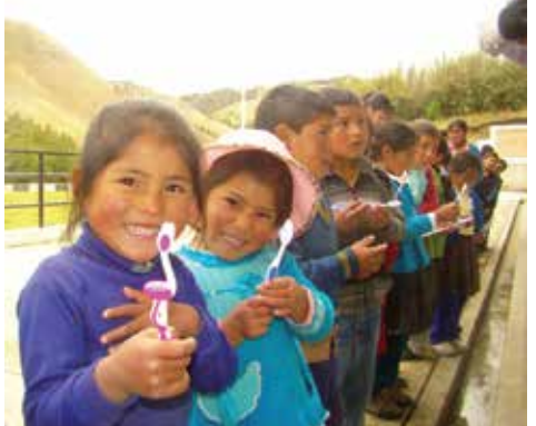
Campaña de fluorización en la I.E. de El Valle, La Encañada.

Integrantes del consejo directivo de la Junta Administradora de Servicios de Saneamiento (JASS) y líderes comunales desarrollan capacidades para la administración, operación y mantenimiento de su Sistema de Agua Potable (SAP), para una gestión participativa y sostenible de los servicios a nivel comunitario.