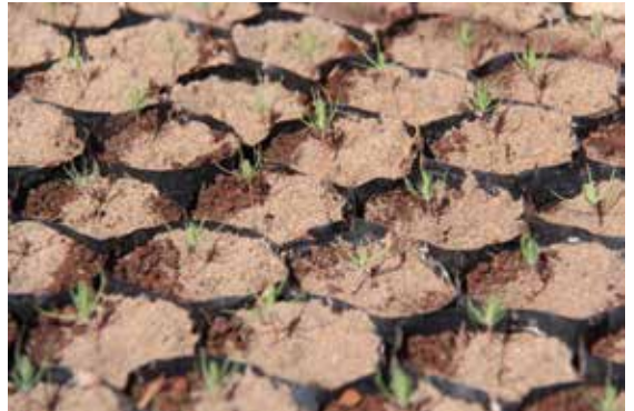
Platines de pino listos para ser instalados.

30% de los jornales generados tuvo la participación de mujeres.