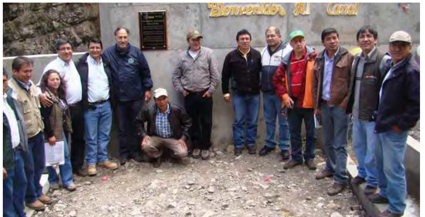
Autoridades comunales, representantes de ALAC, Yanacocha y usuarios en inauguración del canal "La Anaconda".