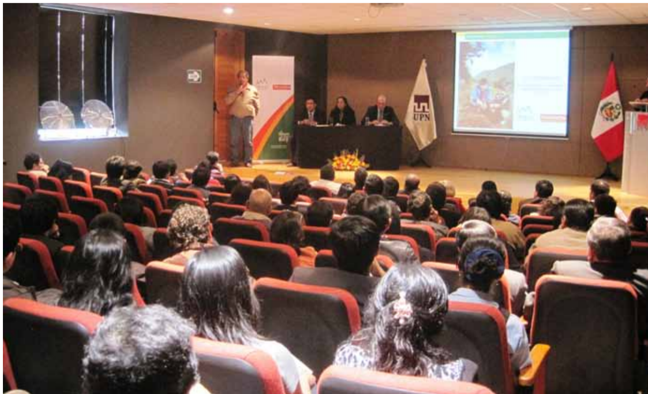
Presentación de resultados ALAC 2012 ante representantes de proyectos de desarrollo, Organizaciones de Base y microempresarios de Cajamarca.