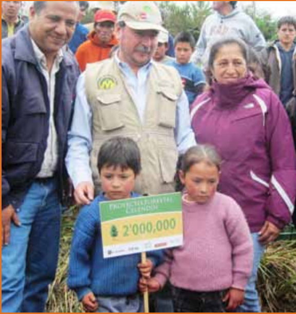
Representantes del Ministerio de Agricultura, ALAC y Yanacocha, en siembra simbólica del Árbol 2 millones - Proyecto Forestal Celendín.